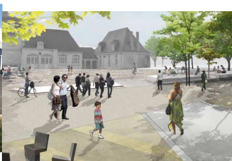
Casernes Beaumont Chauveau