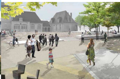
Casernes Beaumont Chauveau