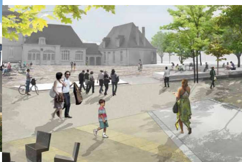
Casernes Beaumont Chauveau