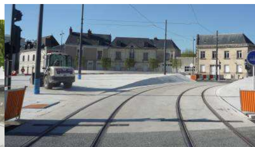
Place de la Tranchée

Arrêté de Monsieur le Maire de Tours n° SC 203 1682 en date du 27 mai 2013 prescrivant l'ouverture d'une enquête publique préalable à la modification N°2 du Plan Local d'Urbanisme de Tours